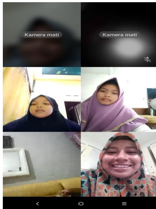
Gambar 2. Dokumentasi Pelaksanaan E-Learning Matematika via G-Meet