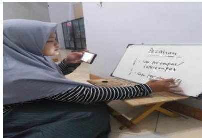
Gambar 1. Pembuatan Video Pembelajaran Matematika