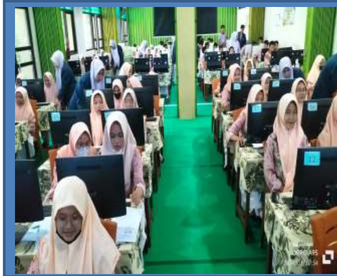
Gambar 3 Uji Coba Modul

Hasil uji coba memberikan gambaran bahwa peserta didik sangat antusias menjawab soal. Hal ini dikarenakan seluruh peserta didik mampu menjawab semua soal yang disajikan pada modul. Kemudian peserta didik bisa langsung mengetahui jawaban salah dan jawaban benar dari soal yang telah dikerjakan. Bagi guru modul literasi berorientasi Asesmen Kompetensi Minimum ini dapat membantu guru untuk memetakan ketercapaian kompetensi peserta didik sekaligus analisis soal. Hasil ini selaras dengan hasil pendampingan kepada masyarakat oleh Zukhrufurrohman dan Putri (Zukhrufurrohman & Putri, 2021) yang menyebutkan bahwa pendampingan literasi dengan melalui modul yang interaktif dan berbasis digital sangat membantu pendidik dan peserta didik dalam mengembangkan kemampuan literasi. Senada dengan itu, kemampuan literasi numerasi juga dapat dilakukan dengan hal yang sama seperti yang telah dilakukan oleh Aini dan Pramasdyahsari. ((Aini & Pramasdyahsari, 2023)