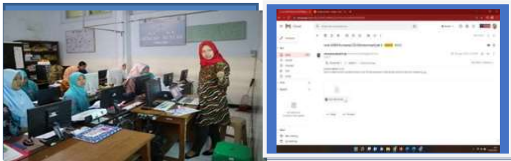
Gambar 2. Proses Pendampingan, Sampel Hasil Pendampingan

Hasil tersebut menunjukkan bahwa pendampingan pembuatan modul ini memang sangat dibutuhkan oleh para guru.(Liady dkk., 2022) selain itu kontribusi madrasah dalam mendukung terlaksananya program ini sangat membantu proses belajar para pendidik.(Rohimah dkk., 2024) selain itu kegiatan pendampingan ini juga merupakan wujud madrasah dalam mempersiapkan pendidik dalam menghadapi era industry 4.0 dan juga era society 5.0.(Rismawati dkk., 2021). Proses dan hasil pendampingan tersebut dapat dilihat pada gambar 2A dan 2B berikut.