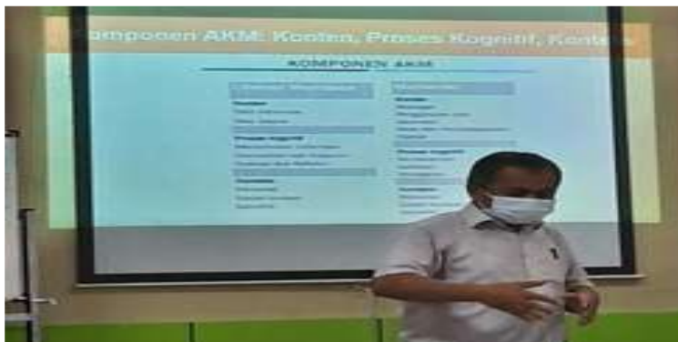
Gambar 1. Penyampaian Materi Workshop

Berdasarkan paparan hasil kegiatan di atas, maka dapat diketahui bahwa kegiatan workshop ini sangat membantu pihak mitra dalam memahami AKM secara konseptual dan mampu menumbuhkan motivasi pihak mitra dalam menambah wawasan dan keterampilan utamanya dalam penyusunan modul literasi berorientasi AKM. Hal tersebut sesuai dengan pendapat Patriana (Patriana dkk., 2021) yang menyebutkan bahwa dalam mengenalkan literasi dan numerasi harus dilakukan pembiasaan demikian pula yang terjadi pada peserta dampingan, perlu adanya pembiasaan mengenal dan mendalami modul literasi berorientasi AKM. Demikian juga menurut Yantimah (Yamtinah dkk., 2022) penguatan literasi juga harus diberikan kepada guru agar dalam membelajarkan literasi membaca dan literasi numerasi dapat berjalan dengan maksimal.